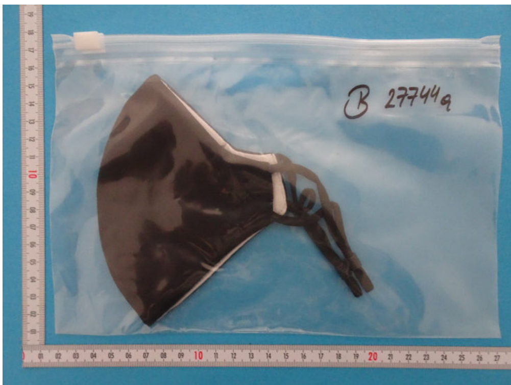
Abb. 2: Art. MA2AV-SHN (B 27744a)