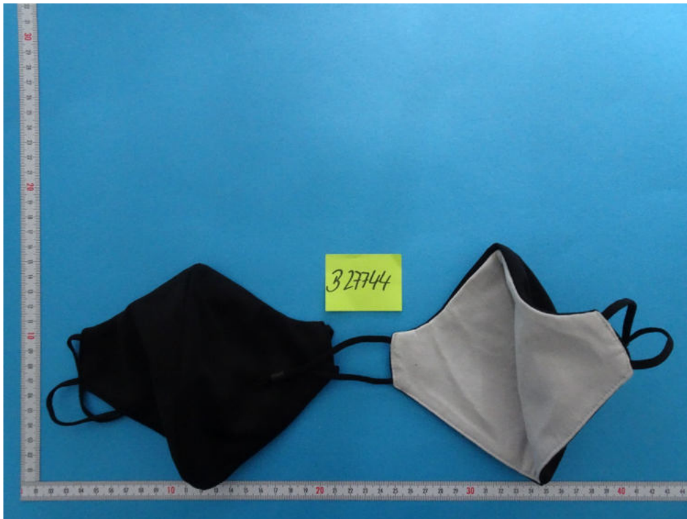
Abb. 1: Art. MA2AV-SHN (B 27744)